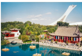
Jardin chinois – Jardin Botanique