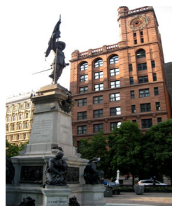
Place d'Armes and New York Insurance Building

Dîner au restaurant le Bistro Vu dans le Vieux Montréal, à vos frais