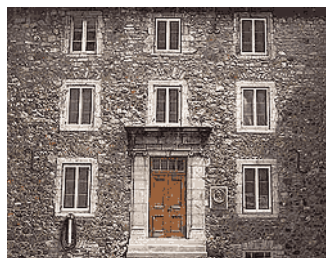
Sulpician Seminary 1685